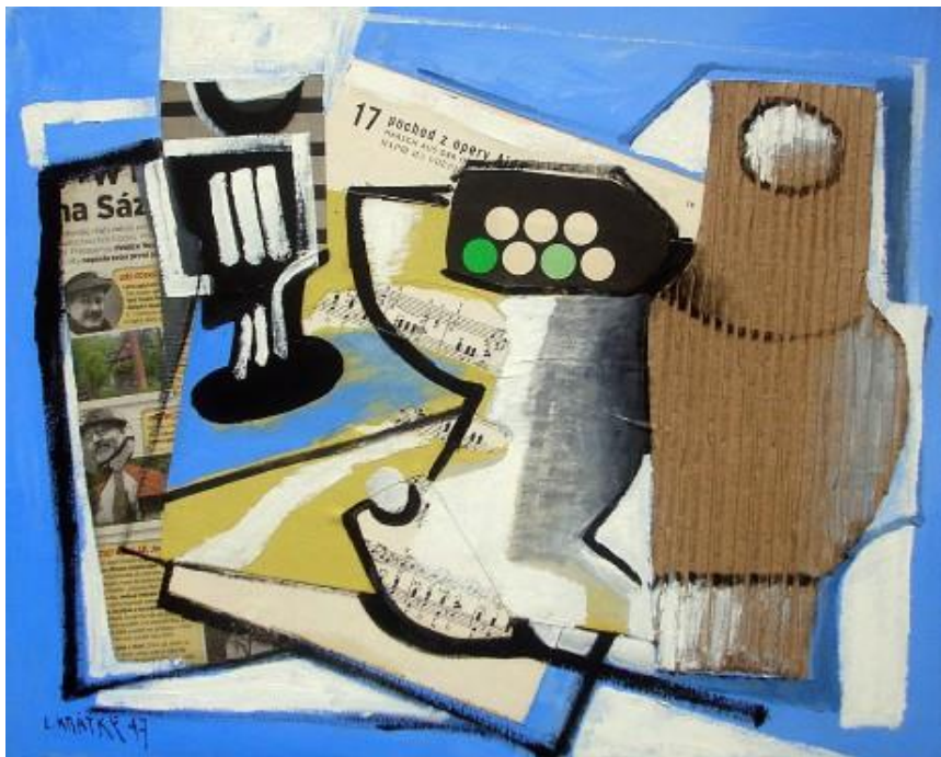
Lubomír Krátký – Zátiší s vázou