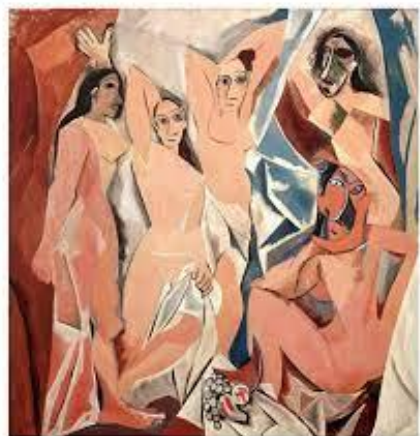
Avignonské slečny – P. Picasso